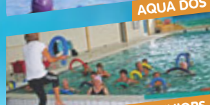
AQUA GYM ACTIFS & SENIORS