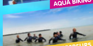
MARCHE DES EMPEREURS